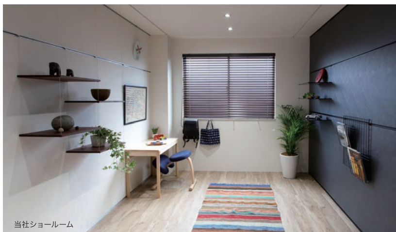
当社ショールーム

既製品の主流である、フック金物にワッカを引っ掛けるスタイルをやめて、美しく設置完了できることを目指したのがディスプレイレール。フレキシブルにパーツの移動が可能なレールを設置することにより、ギャラリー・美術館・店舗・住空間、ディスプレイウインドウなど、壁面ディスプレイの可能性がさらに広がります。